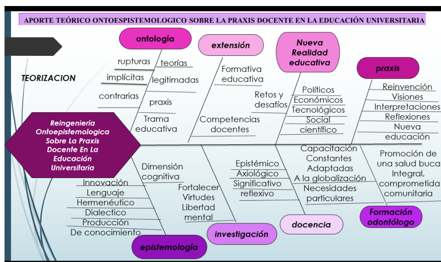
Figura 5. Teorización. Aporte teórico ontoepistemológico sobre la praxis docente en la educación universitaria.

Espero este aporte teórico ayude en la ruptura de las visiones sobre las teorías implícitas de practica y ejercicio de los docentes en la praxis legitimada en nombre de la docencia universitaria, sabiendo su legalidad es siempre una expresión contraria al deber ser de una praxis docente de construcción humana y su mejor versión consigue entrar en contacto con una trama educativa, formativa y pedagógica deja de guardar relación con la identidad, con las competencias del docente y se debaten en el complejo mundo subjetivo, en ella se generan la necesidad de versionar una nueva realidad en construcción, de nuevas visones en la medida de ejecución de la misma.