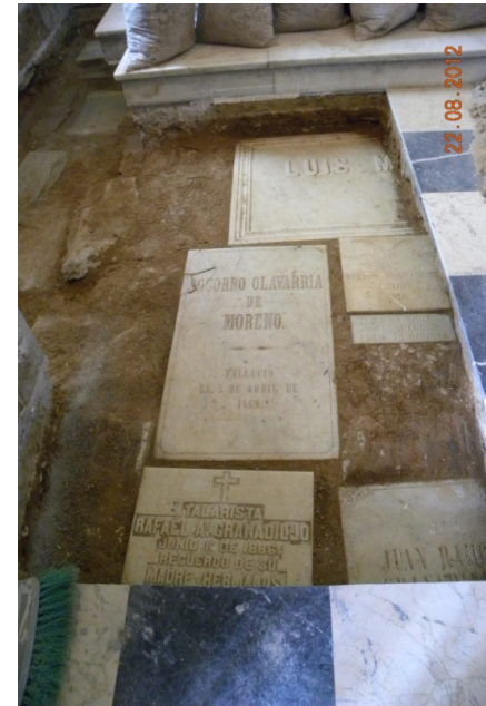
Figura 10. Lápidas bajo el piso de la Iglesia.

Las exploraciones arqueológicas revelaron la magnitud del contenido funerario existente; así mismo, en la cripta se encontraron unos restos de las monjas provenientes del beaterio y en la Catedral hay tumbas identificadas de los Obispos de Valencia. Todas estas circunstancias, concluyeron que en realidad esto debía interpretarse como un complejo yacimiento funerario vinculado al Conjunto Religioso Cultural, a ser estudiado con más exactitud. (Figuras. 10, 11 y 12)