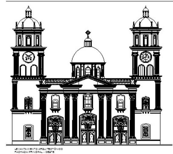
Figura 8. Fachada Principal Oeste. Proyecto de recuperación y conservación de la Catedral de Valencia. Plano original en autocad Arq. Patricia Atiénzar. 2013

Se concluye esta remodelación a mediados del siglo XX, acorde con el momento histórico de ese tiempo en donde todo es válido para alcanzar la modernidad y el progreso. Es el fin de una época, la Catedral tendrá ahora esta otra imagen, que también será la de la Basílica de la Virgen del Socorro (Figura 8)