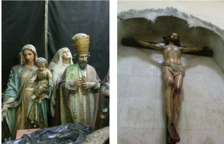
Figura 13 y 14. Colección de imágenes religiosas de diferentes épocas y estilos.

Patrimonio Histórico y Artístico de la Nación" (p.2). Declaración ratificada por la Ley de Patrimonio de 1993, vigente. (p.6)