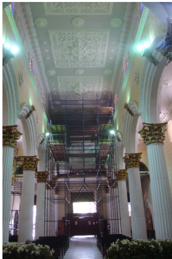
Figura 7. Vista de la nave central en proceso de restauración del techo. Espacio alterado y modernizado por los techos planos sin las techumbres de madera.

Esta intervención, hecha entre 1940-1942, es la última, en este caso la más traumática y destructora, pues cambia la arquitectura del edificio en sus criterios funcionales y espaciales básicos. Las obras complementan la ampliación de la planta de tres a cinco naves. Son demolidos los techos de tejas y las armaduras de madera de par y nudillo conservados hasta entonces y son sustituidos por unas platabandas o losas de concreto armado, cambiando totalmente la espacialidad y la estética. Estos techos planos son recubiertos internamente con decoraciones de yeso elaboradas por el escultor Alejandro Colina (Figura 7). Así mismo se construye otra cúpula sobre el coro, esta de concreto armado, encajada justo detrás del frontis de la fachada principal alterando y confundiendo estéticamente su clásico diseño.