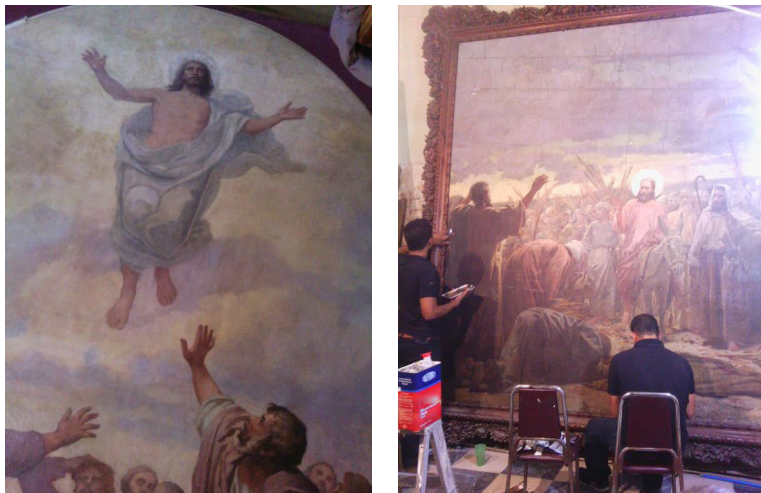
Figura 15 y 16. Colección de pintura religiosa del academicismo valenciano del siglo XIX: Pedro Castillo, Herrera Toro y Juan Antonio Michelena. En proceso de restauración.

Sin embargo, más allá del gran valor de estas piezas como expresión artística debemos ver el patrimonio inmaterial contenido en ellas y su significación religiosa y social. La UNESCO afirma: