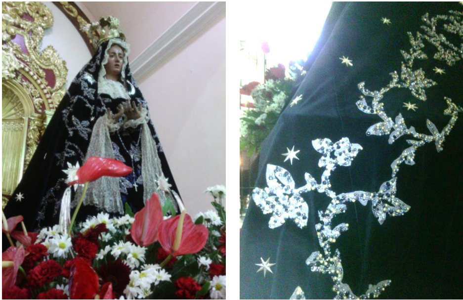
Figuras 21 y 22. Devoción de la Virgen del Socorro. Patrimonio material e inmaterial. Tradición del bordado artesanal de los mantos de la Virgen, en este caso con hilos y estrellas de plata, cristales y perlas. El rosario de plata igualmente, es con técnicas artesanales, donación de un orfebre de la ciudad.

“El patrimonio cultural no se limita a monumentos y colecciones de objetos, sino que comprende también costumbres o expresiones vivas heredadas de nuestros antepasados, y transmitidas a nuestros descendientes como tradiciones orales, artes del espectáculo, usos sociales, rituales, actos festivos y saberes y técnicas artesanales”. (UNESCO, 2003)