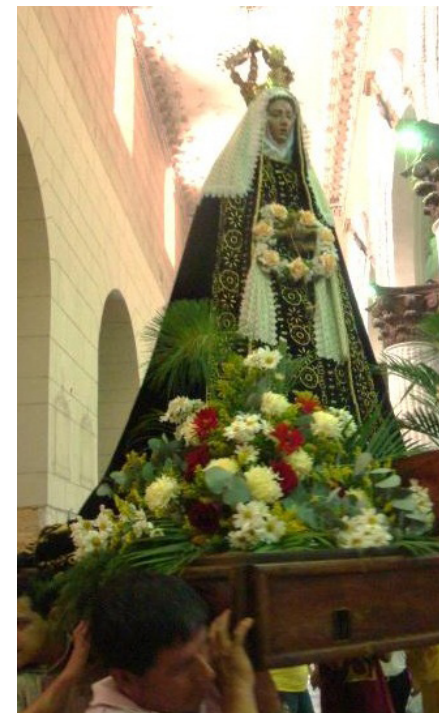
Figuras 17, 18, 19 y 20. Devoción de la Virgen del Socorro. Patrimonio material e inmaterial en vitrales y retablos, en la vestimenta y atributos tradicionales de la Virgen y en las procesiones.