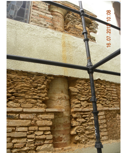
Figura 4. Pilares y corredor exterior del cementerio tapiados.

En el transcurso de la guerra de Independencia, en 1818, el general realista Pablo Morillo ocupa la ciudad de Valencia, encuentra la Iglesia Matriz dañada por el terremoto y decide arreglarla y “modernizarla”. Sus ingenieros militares diseñan y construyen una gran fachada con pórtico neoclásico de orden corintio, adosado, más bien superpuesto, al viejo muro colonial. En este muro fueron conservados elementos del estilo barroco de la vieja iglesia como las cinco ventanas-balcones con arcos polilobulados, estableciendo una mezcla estilística de un eclecticismo precoz.