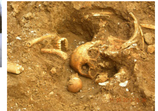
Figura 12. Fosa común encontrada en área externa del cementerio.