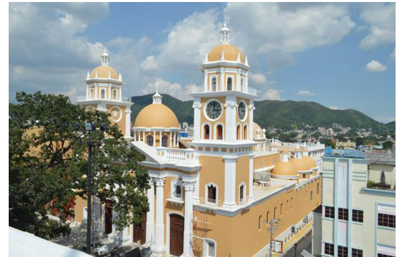
Figura 23. La Catedral de Valencia en el día de su reapertura por la conclusión de los trabajos de intervención.

Sin embargo, las relaciones entre la memoria y el patrimonio cultural no se producen de forma automática. En el caso del conjunto patrimonial, para ser reconocido por la sociedad como propio, debe existir una organizada gestión de patrimonio, basada en la transmisión de los valores materiales, inmateriales y simbólicos, debidamente interpretados a través de la puesta en valor y la musealización, actualmente en proceso.