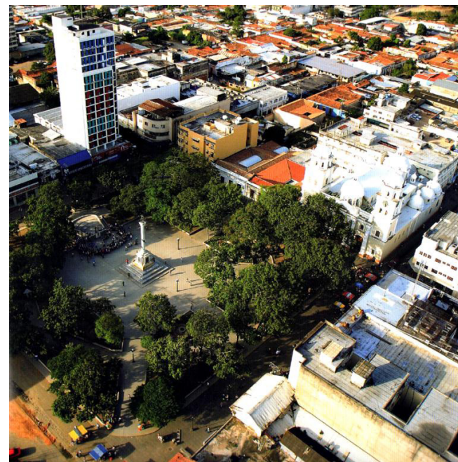
Figura 1. Plaza Bolívar y Catedral de Valencia en la esquina sur-este.

Es destacable la trama fundacional de la ciudad de Valencia diseñada en una cuadrícula de damero perfecto, orientada a los puntos cardinales, comenzando en primer lugar, por la situación de la Plaza Mayor (Figura 1) Se definieron, frente a ella, los lotes en donde debían edificarse el Cabildo y la Iglesia Matriz y esta comenzó a construirse de inmediato.