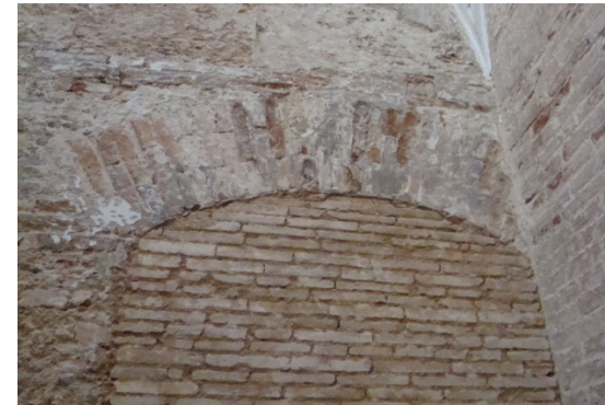
Figura 3. Arcos de ladrillo y vanos tapiados.