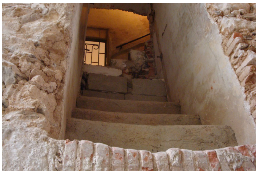
Figura 2. Escaleras ocultas en los muros de la torre norte.

De esta Iglesia Matriz se mantiene actualmente la planta basilical de tres naves, los muros perimetrales de mampostería, dos bóvedas de las capillas de la cabecera y la gran cúpula sobre el presbiterio. De igual forma, se conservan otras piezas de este edificio, como escaleras, pilares y arcos, los cuales se habían perdido en sucesivas modificaciones y fueron encontrados dentro de los muros (Figuras 2, 3 y 4).