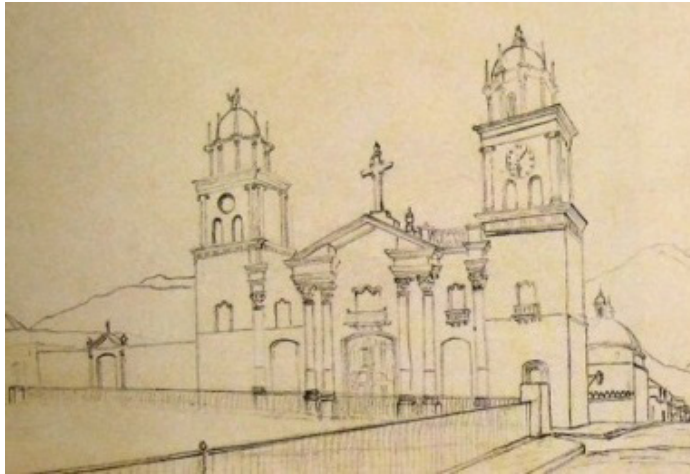
Figura 9. Boceto de la Catedral de Valencia. (1857). Allen Voorhees Lesley Galería de Arte Nacional. Hacia la torre norte se aprecian las paredes y la entrada al cementerio

documentación sobre esto, solamente aparece una referencia en los escritos de La Visita Pastoral del Obispo Mariano Martí en 1791, en donde menciona: “Hay cementerio bueno, cercado de paredes, a la banda del Evangelio, contiguo a la iglesia”. (Gómez Canedo, 1999, p. 86). En un boceto de la fachada, realizado por un viajero en 1857, se observan las paredes, adosadas a la torre norte y la entrada al cementerio destacada con portada neoclásica. (Figura 9)