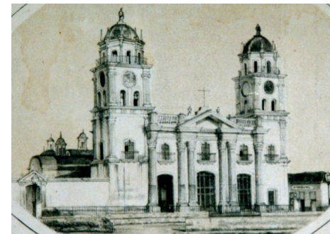
Figura 5. Fachada de la Iglesia Matriz y Cementerio de Valencia. Litografía N° 9 del Álbum “Museo Venezolano” de H. Neum. 1877 – 1878. Caracas. Biblioteca Nacional.

Para completar la composición formal de la fachada, deciden hacerle una nueva torre encima del baptisterio y así establecer la simetría perfecta. Estos cambios definirán para siempre su imagen y presencia (Figuras 5 y 6).