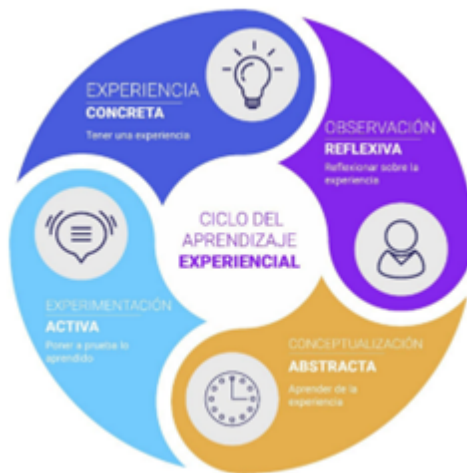
Figura 1. Etapas del Aprendizaje Experiencial (Elaborado por Wang et al., 2021)

De esta forma, el abordaje y la interpretación de las experiencias se relaciona con los procesos cognitivos de cada individuo. Desde esta perspectiva, el aprendizaje sigue un ciclo de cuatro etapas interconectadas: (1) experiencia concreta, en la que las y los estudiantes se involucran activamente en una situación nueva o reinterpretan una experiencia previa; (2) observación reflexiva, momento en que se reflexiona sobre la experiencia desde múltiples perspectivas, (3) conceptualización abstracta, etapa en la que se elaboran conceptos, teorías o generalizaciones partiendo de dicha reflexión; y (4) experimentación activa, donde se aplican los conceptos adquiridos a situaciones para resolver problemas o tomar decisiones. Este enfoque resulta especialmente pertinente en el uso de simuladores, al facilitar entornos donde la práctica, la reflexión y la aplicación se integran de manera cíclica y significativa. En la figura 1, se observa las etapas del aprendizaje a través de experiencias.