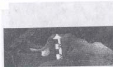
Foto # 2: Trabajo lítico (Zona A)