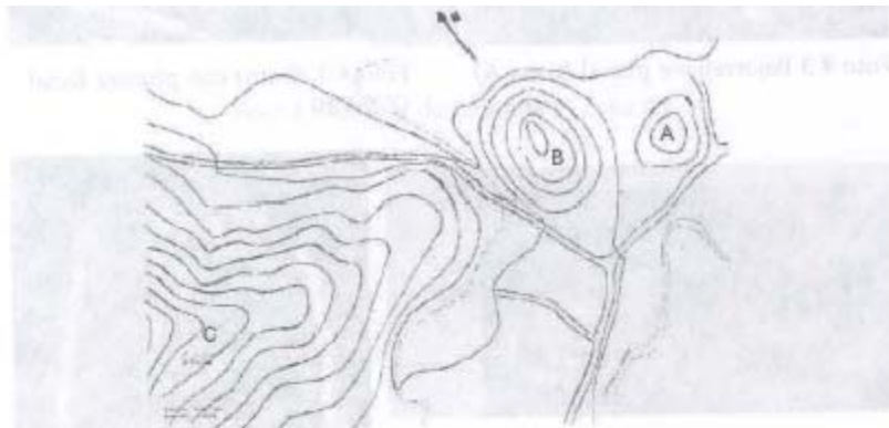
Figura 1: Croquis del Complejo Arqueológico (ver texto para los detalles)