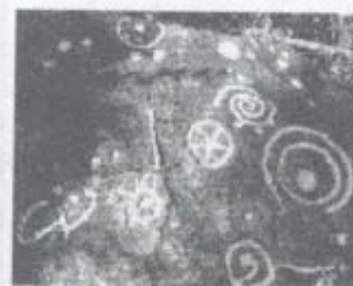
Foto # 15 Caracteres astronómicos (zona C)