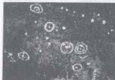
Foto # 14 Eclipse Total de Sol (zona B)