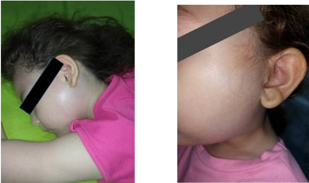
Figura 1. Exploración física de paciente femenina de 5 años de edad.