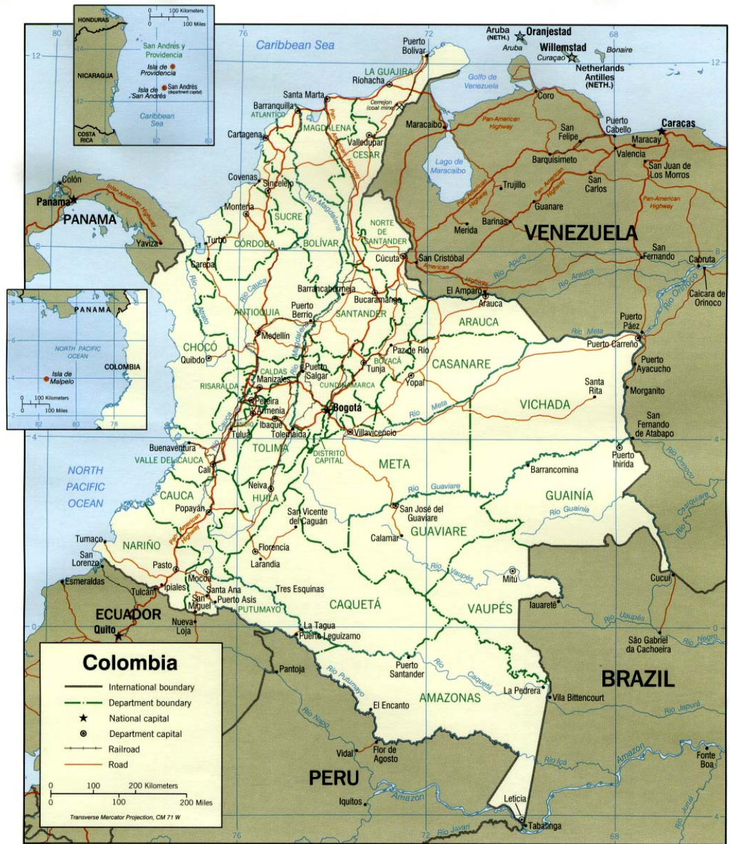
Fig. 4. Mapa Político de Colombia.

subvertir la estabilidad latinoamericana y, a través del país hermano, tener acceso a las riquezas petroleras y, en general, a todos los recursos naturales que tiene el continente suramericano.