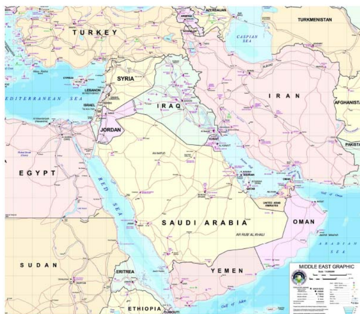
Figura 3: Mapa del Medio Oriente (Asia), donde se destacan los mayores productores de petróleo del mundo, como son Irán, Irak, Kuwait, Arabia Saudita, Yemen, etc.

Venezuela y Brasil. Además Venezuela se ha convertido en el cuarto país con mayores recursos gasíferos a nivel del mundo y primero a nivel de petróleo. Esto lo hace codiciado por las potencias imperialistas encabezadas por los Estados Unidos y Europa. Demos una mirada a la Figura 3, donde se muestran los países del Medio Oriente. En esta región se encuentra la mayor reserva petrolera del planeta (hasta el año 2001) y se ubican los mayores conflictos bélicos mundiales. No parece lógico que las riquezas traigan las guerras, cuando en su lugar deberían aportar progreso. Pero Occidente, especialmente el Imperio de los Estados Unidos, sediento de energía fósil, prepara sus guerras para adueñarse de dichas riquezas. Por ello no es de extrañar que en esta región estén ocurriendo actualmente los mayores conflictos bélicos a nivel mundial.