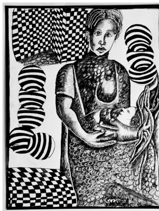
Autor: Cristóbal Ruiz.