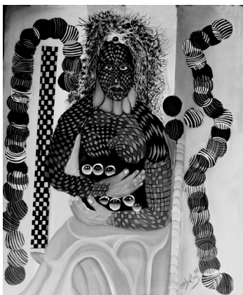
Autor: Cristóbal Ruiz.