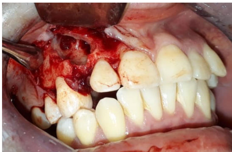
Figura 2. Abordaje quirúrgico para la realización de biopsia excisional

1:80.000, se elevó un colgajo mucoperióstico (de espesor total) marginal triangular con descarga posterior, se prosiguió con osteotomía local en región canina debido a punto de referencia establecido con anterioridad mediante la tomografía conebeam, evidenciando múltiples denticulos (fig.3).