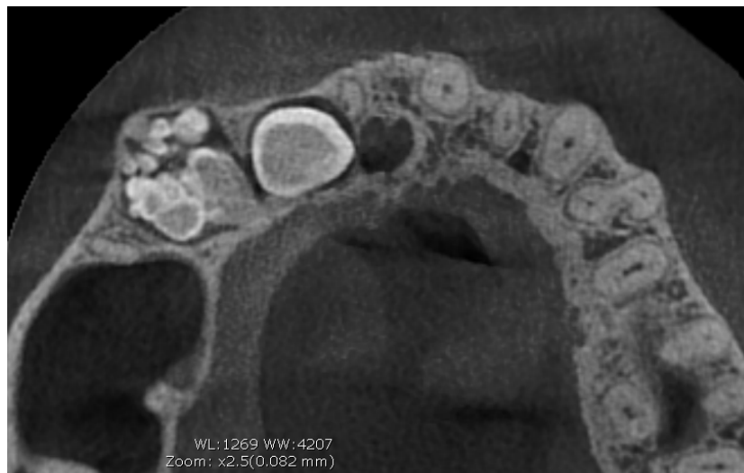
Figura 1.2. Tomografía conebeam corte coronal zona maxilar evidenciando presencia del odontoma