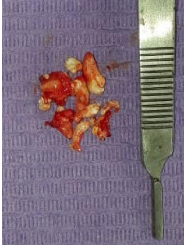
Figura 3. Biopsia excisional muestra macroscópica