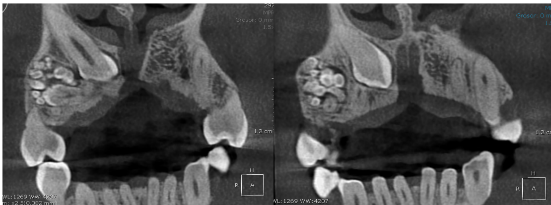
Figura 1.1. Tomografía Conebeam corte axial zona maxilar evidenciando presencia del odontoma

crómica, normohidratada, con espacio comprendido entre la UD12 y 14; se indicó tomografía computarizada de tipo conebeam (fig.1.1,1.2,1.3) para una mejor visualización de la lesión en donde se evidenciaron múltiples imágenes hiperdensas en región comprendida entre incisivo lateral y premolar ipsilateral.